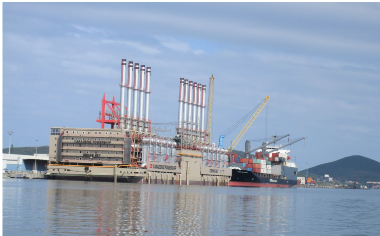
Insolite, ce bâtiment flottant dans la grande rade de Nouméa...

...Il s'agit d'une centrale thermique « accostée » (acronyme CAT). Partie de Turquie en juillet, elle est arrivée à destination début septembre et y séjournera au moins pendant trois ans. Elle a été louée par la SLN pour approvisionner en électricité la toute proche usine de nickel et ainsi suppléer aux déficiences de l'ancienne centrale dont le remplacement est en discussion depuis plusieurs années, sans qu'aucune solution n'ait encore été arrêtée. Il s'agit d'une solution moins énergivore et provisoire...qui peut durer. Ainsi, nous aussi, sommes confrontés à des problèmes d'approvisionnement même si la mise en place de projets solaires et éoliens s'accélère, ce qui à moyen terme devrait améliorer la situation.