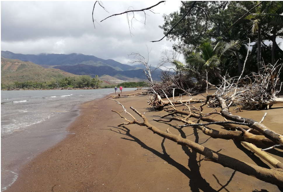
Le bout du bout, traversée impossible...