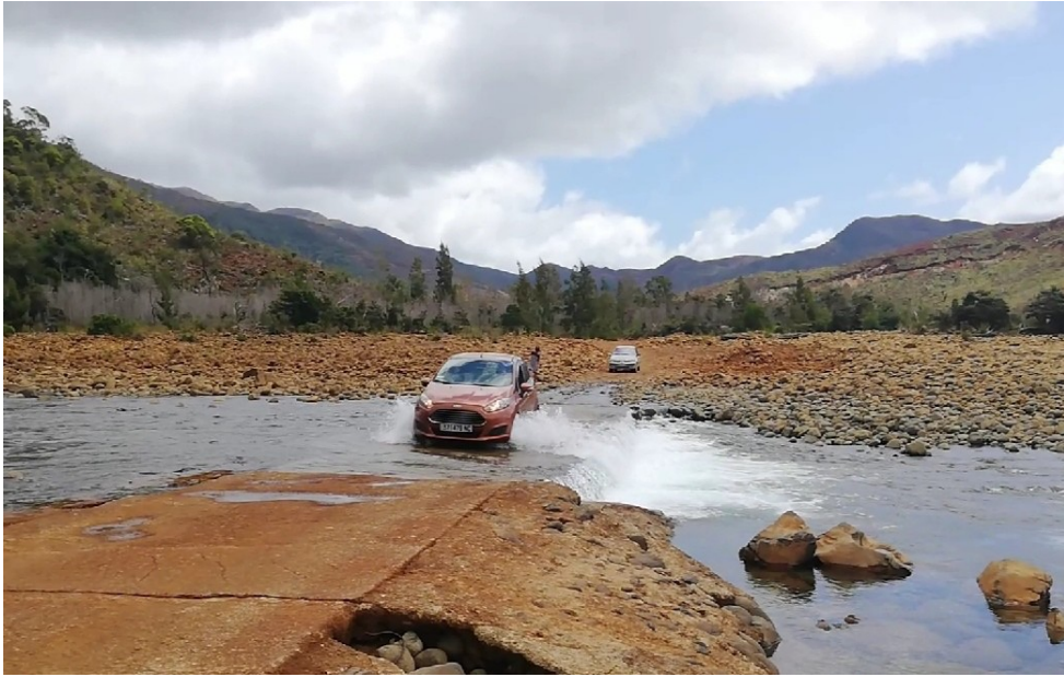
Quelques passages problématiques